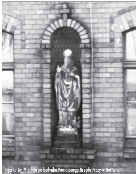
Figurka św. Mikołaja na budynku Powiatowego Urzędu Pracy w Gostyniu.

Jaki byłby wówczas jej wiek? Dlaczego figurkę można skojarzyć ze szpitalem? Czy w budynku straszny? O tym w następnym numerze. GRZEGORZ SKORUPSKI